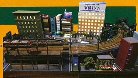
T-TRAK ジオラマコンテスト 2022 東京大会 一般部門 鉄道開業150年賞「京急 平沼駅跡」