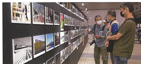
応募作品の写真展も開催

大賞賞金10万円(1作品)、入賞賞金1万円(10作品)。本年テーマは「電気機関車」で、募集開始、応募要綱の発表は3月。大賞、入賞作品、秀作は会場に展示いたします。