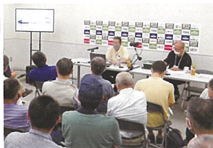
クリニックでは魅力的な講座を用意

技術・感性の卓抜したモデラーから鉄道模型メーカー、実物の研究者、さらには鉄道や製造現場で活躍したプロフェッショナルまで、エキスパートの話が間近で聞ける価値ある90今年も幅広い分野の魅力的な講座を多数設けます。