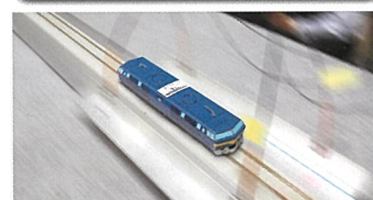
固唾を飲むスピードコンテスト