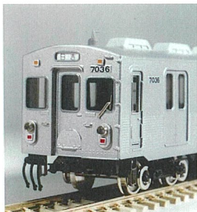
※写真は前回(1998年)製品です

今回は日比谷線直通時代をプロトタイプに東横線の8両編成が組める「4両セット」と、日比谷線乗入れや大井町線での6両編成タイプ(4両+2両)が組める「2両セット」の発売になります。