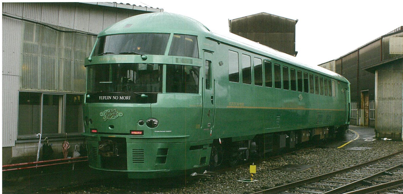
写真は4輛編成時代の実車です。特別に許可を得て撮影しています。

JR九州が誇る観光特急気動車キハ72系「ゆふいの森」を模型化します。現在活躍する5輛編成をモデルとし、特徴的なデッキ部やビュッフェ等の車内設備を再現します。